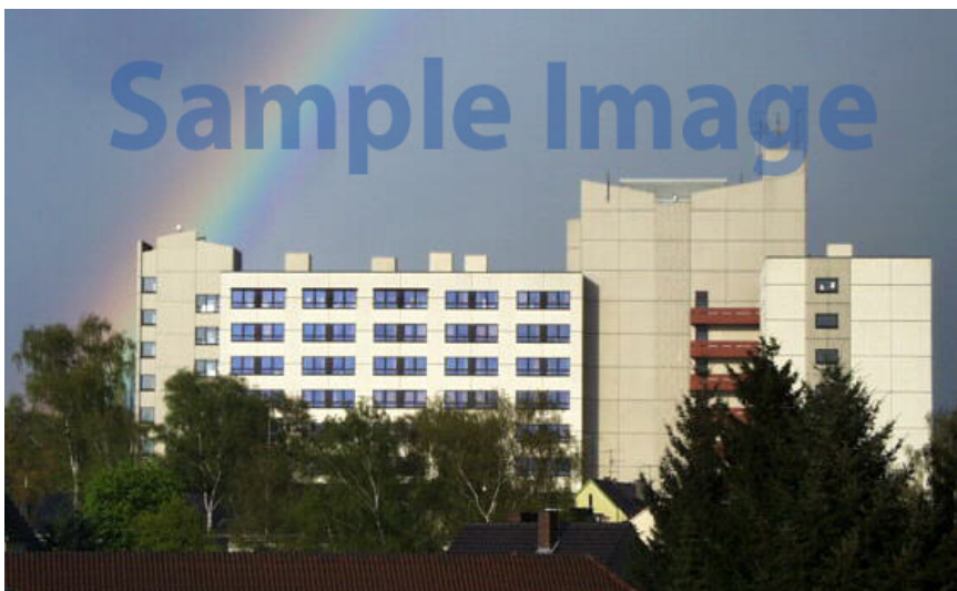
Forschung und Lehre im Krankenhaus